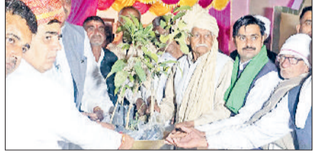
फतेहाबाद। जांडली खुर्द में शादी में 5 पौधों का दान स्वीकार करते वर पक्ष के लोग।