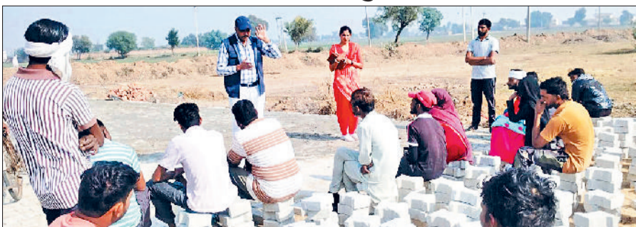
फतेहाबाद। नशे को लेकर गांवों में जागरूकता अभियान चलाती नशामुक्ति टीम।

जिले में ऑपरेशन 'जीवन ज्योति' के तहत नशे से प्रभावित व्यक्तियों के पुनर्वास, काउंसलिंग और सामाजिक पुनर्स्थापना को लेकर व्यापक अभियान जारी है। इसी क्रम में रविवार को नशा मुक्ति टीम फतेहाबाद ने दो गांवों में विशेष अभियान चलाकर अनेक उपचाराधीन व नए चिन्हित ड्रग