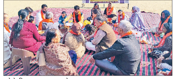
नशे के खिलाफ हवन यज्ञ करते हुए।