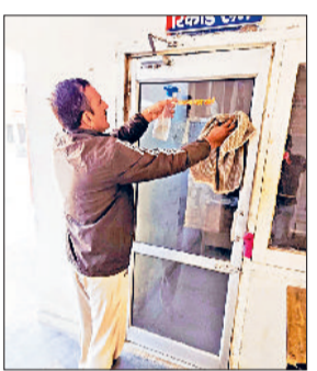
फतेहाबाद। थानों में सफाई अभियान चलाते पुलिस कर्मचारी।