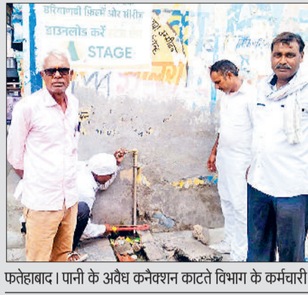
फतेहाबाद। पानी के अवैध कनेक्शन काटते विभाग के कर्मचारी।