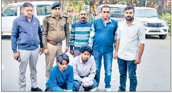
सिरसा। हेरोइन सहित पकड़े गए आरोपी।