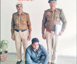
सिरसा। चूरापोस्त बरामदगी मामले में पकड़ा गया आरोपी।

सिरसा। चूरापोस्त बरामदगी मामले में पकड़ा गया आरोपी। पुलिस ने ऑपरेशन हॉटस्पॉट डोमिनेशन अभियान के तहत लाखों रुपये के 46 किलोग्राम चूरापोस्त बरामदगी मामले में खरीदार को गिरफ्तार कर लिया है। गौरतलब है कि नाथूसरी चौपटा थाना की कागदान पुलिस चौकी की एक पुलिस टीम ने बीती 12 नवंबर 2025 को नाकाबंदी के दौरान गांव गुसाईंआना से गोगामेड़ी रोड पर मौजूद थी। नाकाबंदी के दौरान पुलिस टीम आने वाले वाहनों की चेकिंग कर रही थी। चेकिंग के दौरान गोगामेड़ी राजस्थान की तरफ से एक कार आती हुई दिखाई दी। उक्त गाड़ी सवार युवक सामने पुलिस पार्टी को देखकर अचानक घबरा गया और गाड़ी को वापस मोड़ कर भागने का प्रयास करने लगा। शक के आधार पर पुलिस पार्टी ने उक्त गाड़ी सवार युवक को काबू कर शक के आधार पर गाड़ी