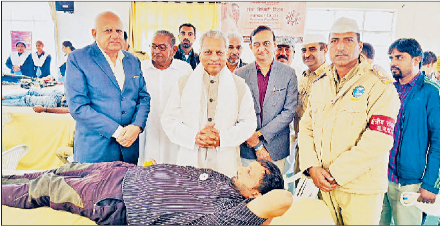
सिरसा। शिविर में रक्तदान करते हुए ग्रामीण।