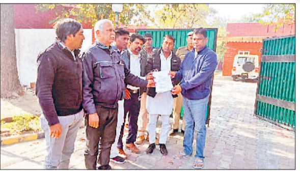
फतेहाबाद। मांगों को लेकर लघु सचिवालय पर धरना देते ग्रामीण सफाई कर्मचारी तथा प्रदर्शन के बाद एसडीएम को मांग पत्र सौंपते ग्रामीण कर्मचारी यूनियन के पदाधिकारी।

प्रार्वधान कर दिया जिसके कारण कभी भी समय पर वेतन नहीं मिलता। यूनियन सरकार से मांग करती है कि समय रहते समस्याओं