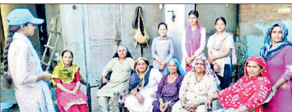
भूना। घर-घर जाकर ग्रामीणों से संवाद करते दहेजमुक्त विवाह करने के लिए जागरूक करते हुए छात्रएं।

समाज में फैली दहेज रूढ़ि कुप्रथा के खिलाफ राजकीय महाविद्यालय, भूना के एनएसएस स्वयंसेवकों द्वारा चलाए गए जन-जागरूकता अभियान ने ऐतिहासिक सफलता हासिल की है। कॉलेज के 150 विद्यार्थियों ने जनवरी से अब तक 40 से अधिक गांवों में अभियान चलाकर ग्रामीणों को दहेज न लेने और न देने का संकल्प दिलाया, जिसका सकारात्मक परिणाम सामने