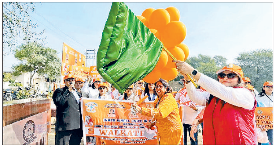
सिरसा। रैली को झंडी दिखाकर रवाना करते हुए।

महिला सुरक्षा, सम्मान और जागरूकता को बढ़ावा देना था। प्रतिभागियों ने ऑरेंज ड्रेस कोड अपनाकर इसका प्रतीकात्मक संदेश दिया। रैली का मुख्य आकर्षण नुक्कड़ नाटक, शपथ ग्रहण, जुंवा, इनर व्हील गीत पर समूह नृत्य रहा। प्रधान हरविंद